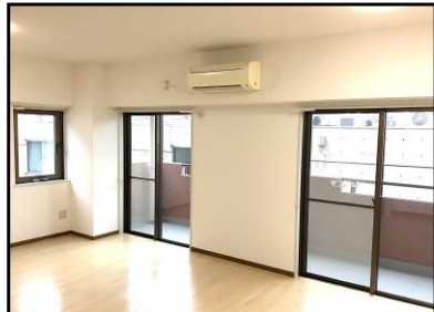
《2面採光・参考写真》