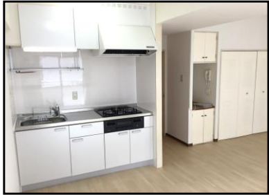
《システムキッチン》

☆システムキッチン (3口コンロ) ☆2人同居 相談可 ☆二面採光 ☆大型バイク 駐輪可 ☆NURO光 導入可