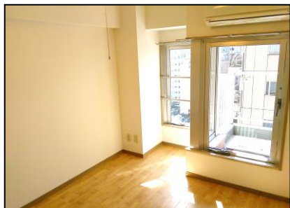
最上階・眺望&日当たり抜群！