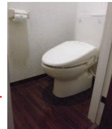
◎居室照明・カーテン・シャワートイレ 設置済み