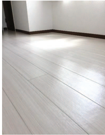
◎室内クロスと床を 貼替済み