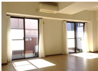
●明るい南向き《参考写真》●