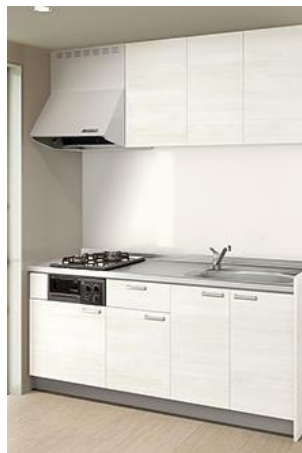
●システムキッチン《参考写真》●