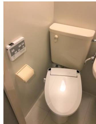
※温水洗浄便座 新規取付