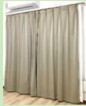
◎カーテン設置済み