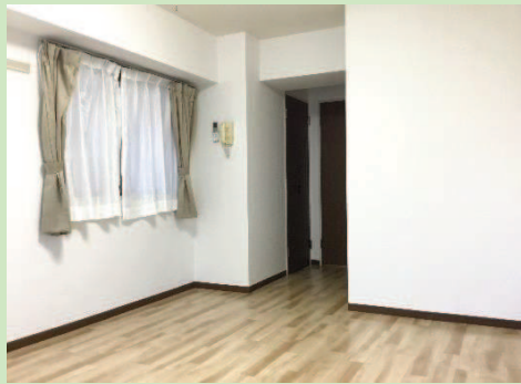
◎室内クロスと床を貼替済み