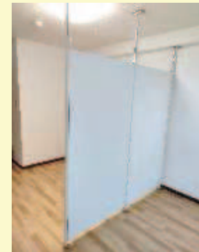
パーティション設置致しました