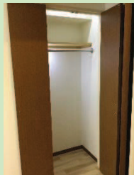
◎約1.2畳のウォークインクロゼット等収納充実