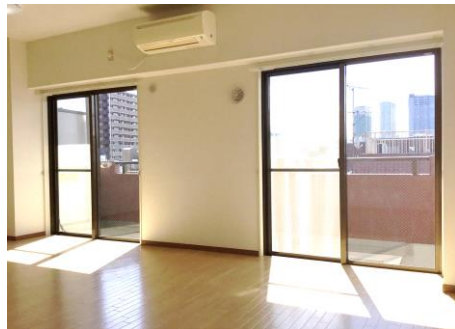
●日差したっぷりの明るい居室●