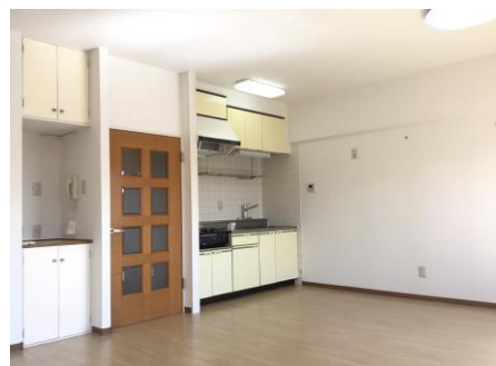
●クロス・床 全室新品●