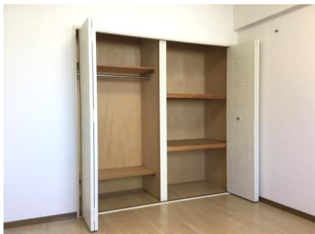
●収納クローゼット有●