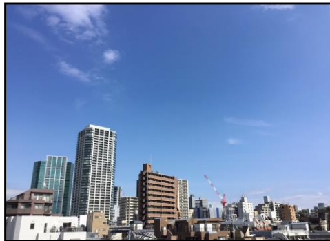
《バルコニーからの景色》