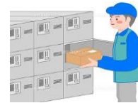
《宅配ロッカーあります》