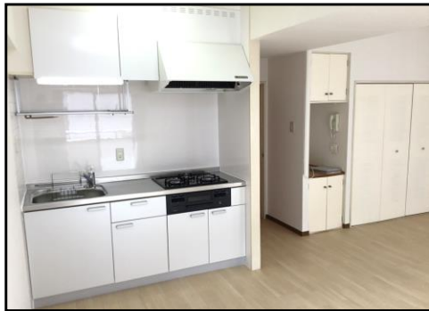
《システムキッチン》

☆システムキッチン（3口コンロ） ☆2人同居 相談可 ☆二面採光 ☆大型バイク 駐輪可