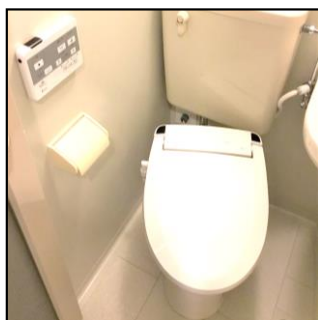
《温水洗浄便座 新規設置》