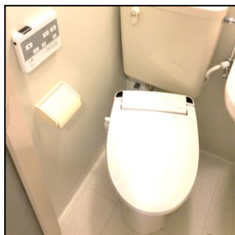
《温水洗浄便座 新規設置》