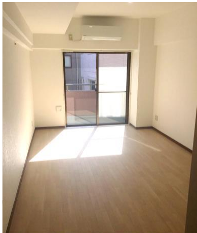
《参考写真・床を白色CFにします》

洋室 9畳 のお部屋！ 床 クロス 水栓 温水洗浄便座 新品 エアコン2024年製 大型バイク 駐輪可！ モニター付インターホン 設置済！ NURO光 共用部迄工事済！