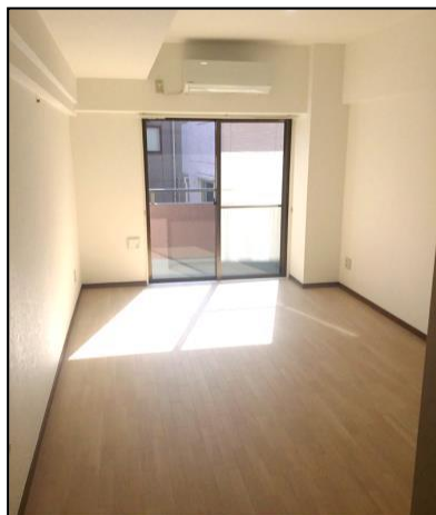
《広々洋室9畳・明るい南側・参考写真》