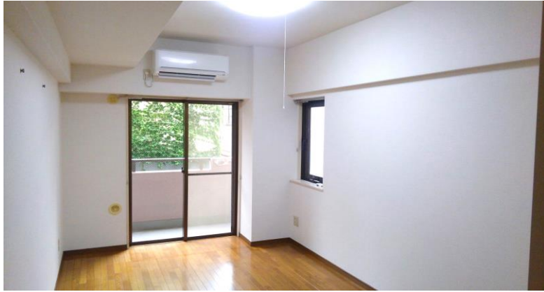
《参考写真・約9畳の洋室・角部屋・南向き》