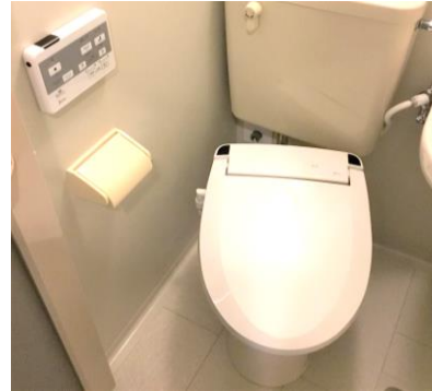
《温水洗浄便座 新規設置》