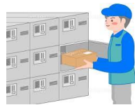
《宅配ロッカーあります》