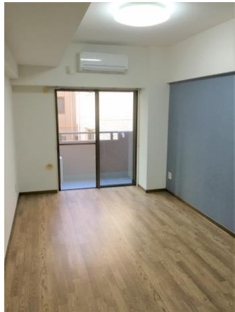
南向きの9帖部屋(203号室写真)