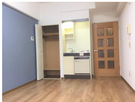
クローゼット有(203号室写真)