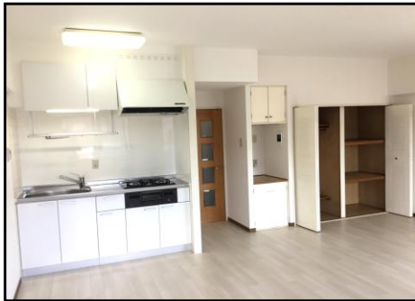
《システムキッチン・クローゼット》

☆システムキッチン(3口コンロ) ☆NURO光 導入可 ☆洋室・廊下・トイレ 床リニューアル ☆2人同居 相談可 ☆大型バイク 駐輪可