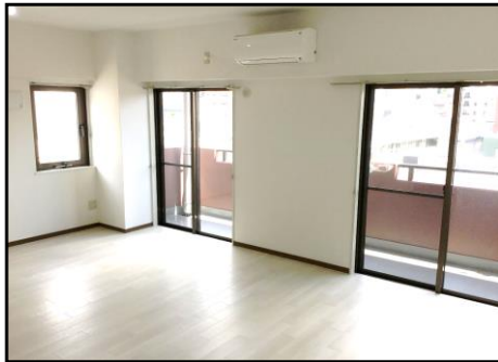
《2面採光・床を白色にリニューアル》