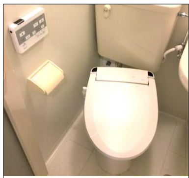
温水洗浄便座 新規設置