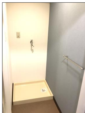
お洒落なアクセントクロス(304号室写真) 全室南向き(203号室写真) 室内に洗濯機置場有