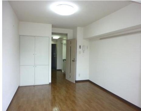
《参考写真/床を白ベニシにリニューアルします》