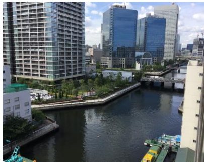
★日当たりが良いお部屋★