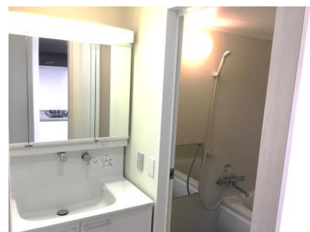
◆使いやすい3面鏡・広めの浴室◆