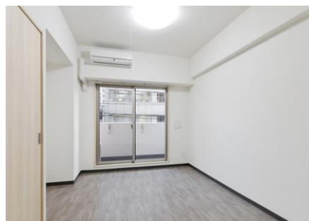
◆高さ 2.6 mの天井◆